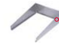
Spritz- & Windschutz