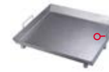
Pfanne, TYP WB-3

kombinierbar mit weiteren Pfannen und Kombi-Grillrosten der Geräteserie steelline edition zum Einsatz über drei Gasbrennern.